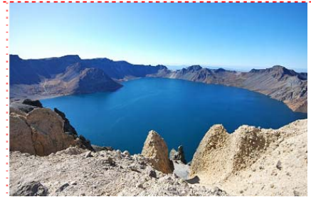
五星級標準長白山金水鶴國際酒店或長白天地酒店或王朝聖地酒店或同級

早餐後前往著名的長白山北坡景區，【天池】呈橢圓形，是火山噴發自然形成的火山口湖，天池湖面面積 10 平方公里，是一個巨大的天然水庫，在周圍十六座山峰的環抱中，沉靜清澈的天池猶如一塊碧玉一般，給人以神秘莫測之感。【溫泉群】長白溫泉有“神水之稱”，長白山溫泉屬於高熱溫泉，多數泉水溫度在攝氏 60 度以上，最熱泉眼可達 82 度，放入雞蛋，頃刻即熟。【地下森林】亦稱谷底林海，是一處火山口森林，長白山谷底林海距長白山冰場東 5 公里，洞天瀑北側，谷底穀松參天、巨石錯落，人稱穀底人家，為長白山海拔最低的勝景區。【美人松】美人松學名長白松。生長於長白山二道白河，和平營有純或單株散生。美人松因形若美女而得名，是長白山獨有的美麗的自然景觀。【長白瀑布】，隨山勢而傾瀉，粗壯時若大海倒懸，天河決口，雪濤滾滾，氣勢磅礴(看季節)；消瘦時又如匹練懸掛，悠然飄揚。長白瀑布由於落差大，瀑布落入底下幽谷深潭時，濺激起數丈高的水柱白浪，似雪堆崩飛。升騰起雲霞雨煙，颼颼灑灑，四處灑逸。若走近瀑布，由於長白山天池之水較冷冽，瀑布激起的煙雲亦寒氣襲人。身置一片迷離之中，不覺是天上還是人間，那紛紛撲面而來的雨霧，將渾身上下灑得濕漉漉一片，亦把太陽遮蔽得朦朧失色。