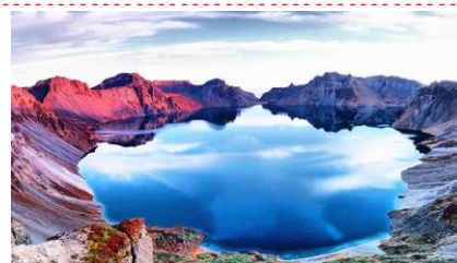
朝鮮族主題長白金港溫泉度假酒店或同級

早餐後赴長白山地區僅存的原始村落“錦江木屋村”，錦江木屋村是一個自然形成的村落，由 1677 年清朝留守滿族人居住開始，至今已 300 餘年，目前長白山地區唯一有文化歷史的村落，現已被列入吉林省重點文物保護單位，被國家民委命名為中國少數民族特色村寨。村落地處深山莽林之中，木牆、木瓦、木煙囪、木柵欄，整個村子不見一磚一瓦，是迄今為止東北地區和長白山區僅存的一處傳承性的滿族木屋群，被專家譽為：長白山最後的木屋村落。村內可體驗烙煎餅、豆腐坊拉磨、酒坊燒酒等活動。繼往著名的 長白山南坡景區這裡是鴨綠江的發源地 ，區域內生態系統和諧，原始風貌保存完整；世界最高、最深的火山口湖—長白山天池在此較比西、北、東面展示的更加完美、恢弘。這裡有世界上罕見的苔原河谷濕地，分佈廣泛的高山花園，相依相戀的松樺林帶，歸隱山林的嶽樺雙瀑，劫後餘生的炭化木遺跡，溝壑幽深的鴨綠江大峽谷等，後赴長白縣參觀 AAA 級朝族村落“果園村”這是最具代表性的朝族村落，它對面就是朝鮮的第二大城市惠山市僅一江之隔，對面的民居生活、軍人清晰可見；