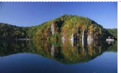
住宿北京空港遠航國際酒店或雲逸國際酒店或同級或上海航空酒店或同級或哈爾濱維也納酒店或同級

(7至8月份鮮花盛開)(9至10月份秋色美極) 早餐後乘車前往。早餐後乘車前往輝南縣，遊覽 AAAA 級景區“三角龍灣”，它是進入長白山的門戶之一。這裡自古以來風光秀美，景色迷人。我國著名第二大火山群—龍崗火山群就分佈在這裡。是 20 萬年前火山噴發後地下水上升聚集而成的火山湖。湖的周圍青山環抱，象一條巨龍盤臥在湖邊，又稱火山湖為龍灣。乘車赴冰城哈爾濱(晚抵)