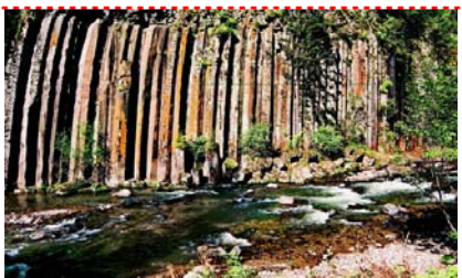
白山喜盈門大酒店或億佳合大飯店或富麗華酒店或輝南賓館或同級

早餐後乘車前往十五道溝，“鴨綠江上游國家級 AAAA 自然保護區”望天鵝景區位於長白腹地吉林省長白朝鮮自治縣十五道溝，這裡古樹參天，花草競秀，怪石嶙峋，是以奇石飛瀑聞名。繼乘車赴中朝邊境城市—臨江市，臨江市是黨和國家領導人陳雲同志曾經親自指揮的“四保臨江戰役”的地方，他粉碎了國民黨的南攻北守、先南後北的戰略計畫…… 臨江市。