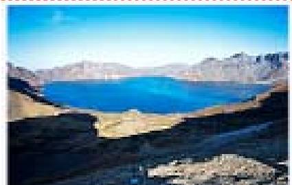
長白山觀嵐度假酒店或白溪假日大酒店或天沐戴斯酒店或同級

早餐後遊覽長白山西坡景區，長白山西坡完整地保留了長白山的原始風貌。從西坡登上巍巍的長白山，您就能更好地領略長白山的天工、博大和神奇；您就能更好地欣賞大自然這個無所不能的造物主送給我們人類的驚天地駭鬼神的傑作；您就能更好地受到長白山博大精深的文化對您的薰陶。西坡景點有：高山花園、松樺戀、雙梯子河、錦江大峽谷、長白山天池。(如不能前往長白山西坡景區改為安排萬達長白山國際度假小鎮)(如遇長白山大雪及有雪地摩托車營運，可換乘雪地摩托車，客人自行排隊買票(最少 8 人)，及需要自理雪地車往返天池費用大約 RMB400 人，資訊如有變動以當時為準，單程車程約 10 分鐘，不前往的客人在景區外自由活動)