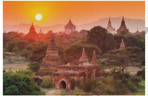
遠處觀賞緬甸的天空之城湯恩格拉德寺

前往【 阿南達佛塔 Ananda 】(城外)：蒲甘最美的塔，最能代表緬甸早期的佛塔建築，精巧對稱的設計敷著白泥雕飾，令人讚歎！Ananda 公認是蒲甘平原上最美的佛殿，精巧對稱的設計敷著白灰，不論牆內、外的灰泥雕飾，或是經典的 Chinthe 都讓人讚歎。相傳 1105 年奇安紀薩國王在 8 位印度聖人幫助下，完成這座平原上最傑出的佛殿。從 Ananda 的平面圖可以發現，這是希臘十字(Greek Cross)建築，這是之前不曾出現的設計，同時還結合了孟族佛殿風格，令專家訝異。Ananda 是四方對稱的設計，4 個大殿面對四方，各有一尊高 9.5 公尺的立佛，目前只剩南、北兩面的佛像是原造的，設計者在廊壁上開有圓型天窗，使光線可照在佛面，極具巧思。接著前往