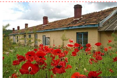
四星級標準漠河紅金鼎大酒店或同級

前往洛古河村，中俄界河額爾古納河與從俄羅斯方向流來的石勒喀河匯聚後始稱為黑龍江，兩河匯合處為黑龍江源流。遊人在原始的無人為修飾的源流盡情觀賞中國第三大河起始處的自然風光。