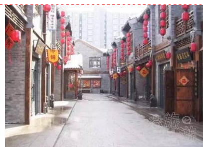
住宿北京空港遠航國際酒店或雲逸國際酒店或同級或上海航空酒店或同級或哈爾濱維也納酒店或同級

前往【蒸氣火車頭廣場】是哈爾濱鐵路局使用的火車頭全是偽滿時遺留下來的舊機車，只不過把日文改成了中文或拼音。1959 年起哈局開始使用國產的火車頭，“前進”型機車是 1966 年配備的大功率蒸汽機車，一直使用到 1987 年貨運改為內燃機牽引止，八十年代末是蒸汽機車的最後謝幕時期。