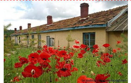
四星級標準漠河紅金鼎大酒店或同級

前往洛古河村, 中俄界河額爾古納河與從俄羅斯方向流來的石勒喀河匯聚後始稱為黑龍江, 兩河匯合處為黑龍江源流。遊人在原始的無人為修飾的源流盡情觀賞中國第三大河起始處的自然風光。