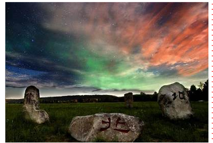
北極村或北紅村家庭賓館或同級

前往烏蘇里淺灘景區進發, 烏蘇里淺灘緊挨着中俄界河黑龍江, 一江之隔的對面山頭是俄羅斯國土。大自然的鬼斧神工造就了北國這一天下奇景。這裡已被圖強林業局開闢為自然風光旅遊景區, 名稱確定為“烏蘇里淺灘風景區”。緊接着趕到龍江第一灣景區, 上山之路設有木棧道梯級。紅旗嶺的山上是欣賞龍江第一灣的最佳位置, 居高臨下遠眺前方風景怡人, 中俄界河額爾古納河與俄羅斯方向流過來的石勒喀河匯合後就成為黑龍江的源流, 這個長度達三十公里的神奇大 U 形灣, 就是黑龍江第一灣。