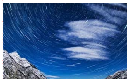
北極村家庭賓館或同級

中國最北自然村—北極村，景區大門處有原國家主席楊尚昆題字的中華北陞碑亭可供遊客拍照留念；村口北極村標志碑也是遊客拍照留念的好地方。參觀北極村景區景點。北極村是集休閒娛樂、遊玩於一體的綜合性景區，景區最重要的特征就是：處處可感受神州北極地理特點，“北”是這裏的名片和標志。